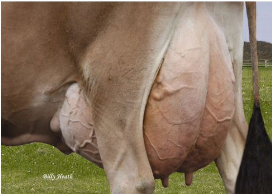
LUCKY HILL JOKER WAVORITA FOURTH DAM